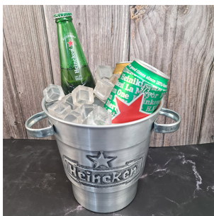
HC1005- FRAPERA DE ALUMINIO, CINCELADO, MED. 20 X 19 X 13